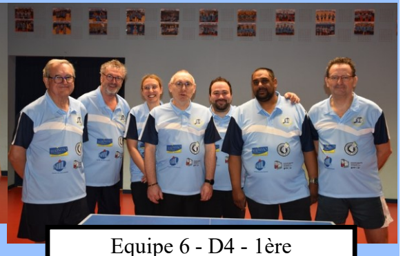
Equipe 6 - D4 - 1ère

L'équipe 2 en Pré-Régionale enchaîne une victoire 13 à 7 sur l'Herbergement 2, un nul 10 à 10 sur une bonne équipe des Landes Genusson 1 et une défaite 14 à 6 sur le leader Ste Florence / Vendrennes 1. L'équipe cherchera le maintien. Elle se classe actuellement 4ème.