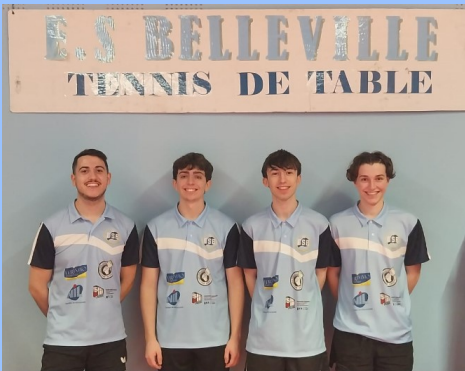
Equipe 1 - R3 - 1ère ex-aequo

L'équipe 6 en D4 remporte ses trois premières rencontres de très belle manière avec des scores fleuves 20 à 0, 16 à 4 et 14 à 6. Un match clé s'annonce pour une remontée en D3 le dimanche 17 mars en recevant Bouin 2. A vos calendriers, pour venir les encourager !