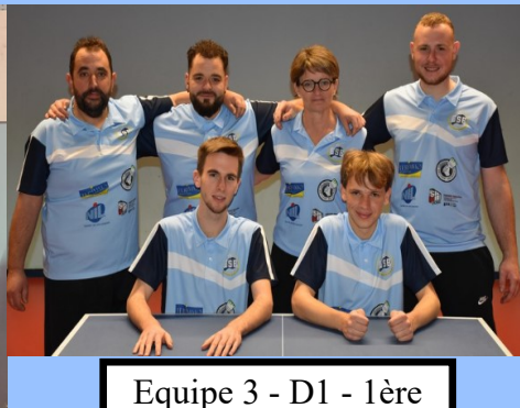
Equipe 3 - D1 - 1ère