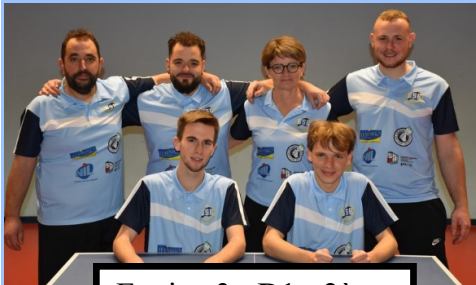
Equipe 3 - D1 - 2ème