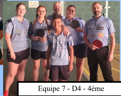
Equipe 7 - D4 - 4ème