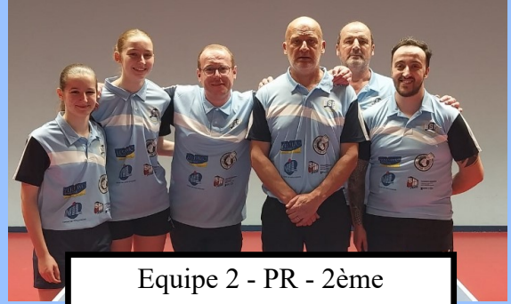
Equipe 2 - PR - 2ème