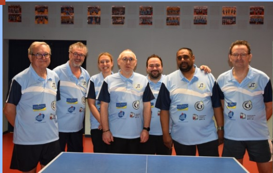
Equipe 6 - D4 - 1ère