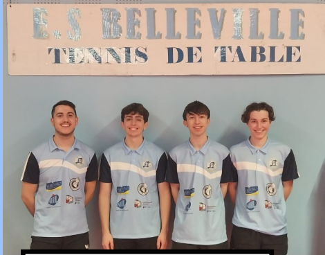
Equipe 1 - R3 - 2ème

Sur cette première journée, toutes les équipes se sont imposées, seule l'équipe 4 en D2 se fait surprendre sur St Gilles Croix de Vie et ses anciens. Les deux prochaines journées auront lieu dimanche 4 février et dimanche 11 février.