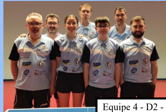
Equipe 4 - D2 - 7ème